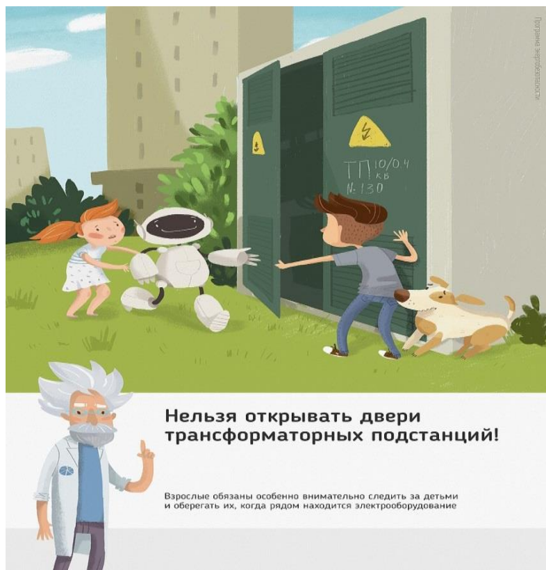
Рис.1 Нельзя открывать двери трансформаторных подстанций

Ежегодно энергетики проводят для школьников познавательные уроки, конкурсы рисунков и историй на тему электричества и правильного с ним обращения. Но работы одних энергетиков в данном направлении недостаточно, для полного понимания проблем электробезопасности нужен пример общества, в котором растет ребенок, и, конечно же, главным образом родителей. Эта работа приносит свои результаты: электротравмы на энергетических объектах единичные, и каждый случай становится поводом для служебной проверки. Но только технических мер мало для того, чтобы полностью обезопасить детей. Им нужен пример родителей.