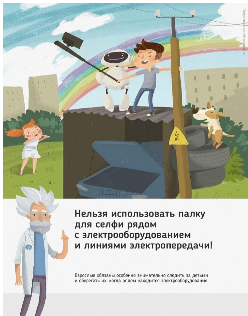
Рис 2. Нельзя использовать палку для селфи рядом с электрооборудованием и линиями электропередачи

Ну и, наконец, нужно повторить с ребенком алгоритм действий в экстремальной ситуации. Проверьте, умеет ли он набирать на сотовом телефоне телефон экстренных служб. Изучите с ним вещества и предметы, которые хорошо проводят электрический ток и потому особенно опасны, и, наоборот, вещества и предметы, плохо проводящие электрический ток и полезные в экстремальной ситуации.