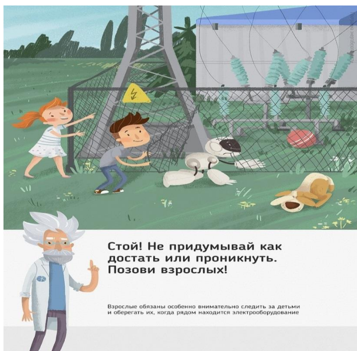
Рис. 5 Стой! Не придумывай как достать или проникнуть. Позови взрослых!