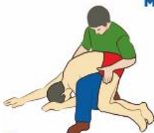
Удалить воду из дыхательных путей