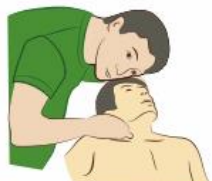
Установить наличие пульса на сонной артерии