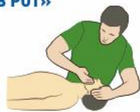
Очистить полость рта от инородных предметов