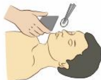
Определить состояние самостоятельного дыхания